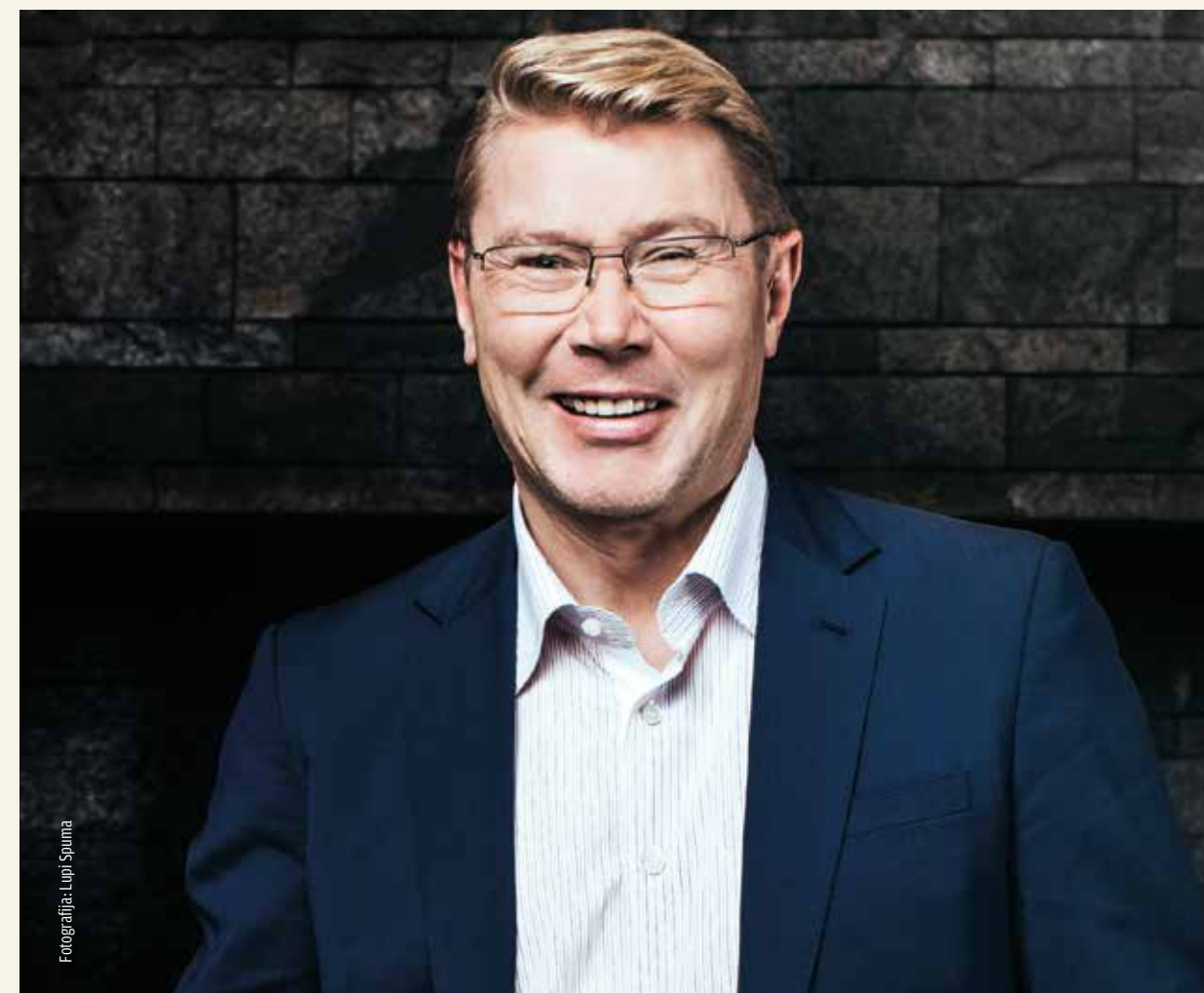
MOŠKI S POZITIVNIM ODNOSOM DO ŽIVLJENJA: MIKA HÄKKINEN SE SICER RAD SPOMINJA VSEH SVOJIH USPEHOV, ČEPRAV V SVOJEM ŽIVLJENJU RAJE GLEDA NAPREJ.

Eden redkih slabih spominov je zagotovo vaša težka nesreča leta 1995 v avstralski Adelaidi, po kateri