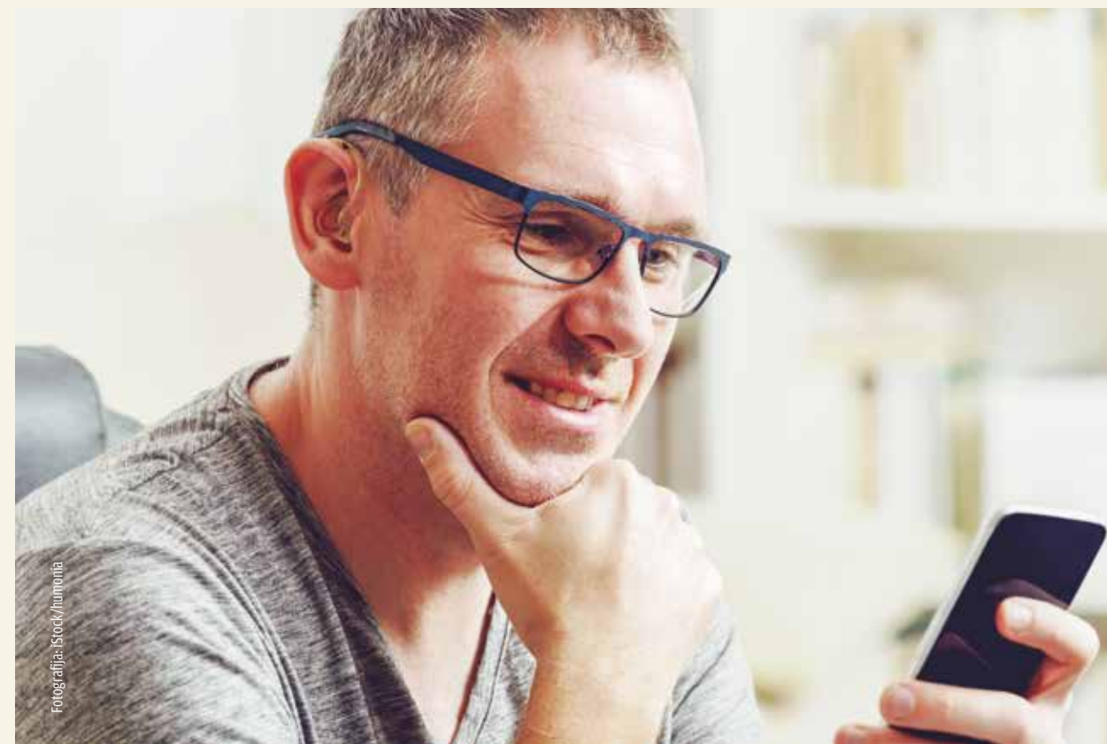
SLIŠATI TAKO KOT PREJ Z JUTRIŠNJO TEHNOLOGIJO: BREŽIČNA POVEZAVA PAMETNEGA TELEFONA IN SLUŠNIH APARATOV OMOGOČA NOVE MOŽNOSTI UPORABE.

Tudi posebne aplikacije za prevajanje jezika že dolgo niso več znanstvena fantastika: Če sogovornik govori v moj pametni telefon, slišim s pomočjo svojih slušnih aparatov povedano že ustrezno prevedeno. V bližnji prihodnosti bodo lahko slušni aparati to funkcijo opravili sami – ko bodo imeli dovolj prostora za shranjevanje. Z inovacijami, kot je možnost prevajanja, se ukvarjajo med drugimi tudi na nemškem raziskovalnem